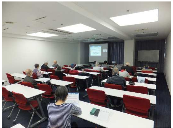
介護保険のしくみについて/愛知の果物の話し